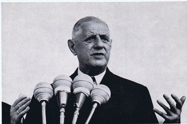
Charles de Gaulle (zu: Zwanzig Jahre nach Jalta , S. 15)